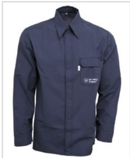
Hemd BSD Light Art.Nr. 460102x